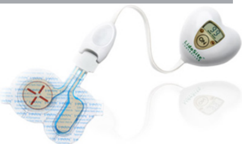
Phase 1 Triptan Study – Migraine